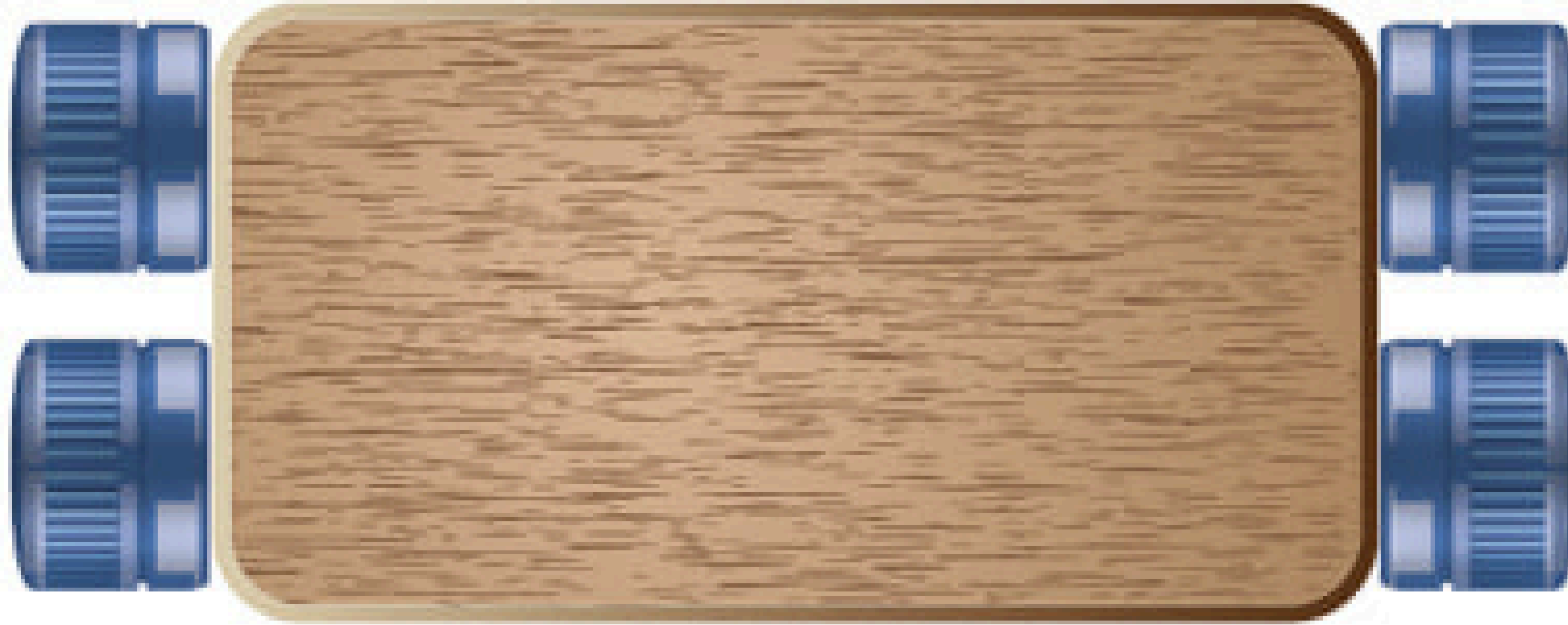
Şekil 1-B Üstten görünüm